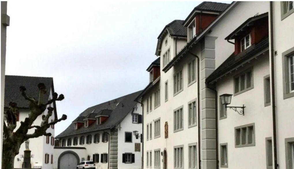
Kloster st martin aktion