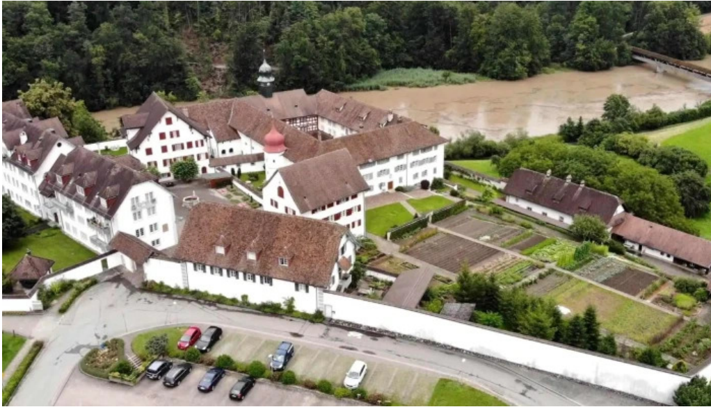
Kloster st martin kloster