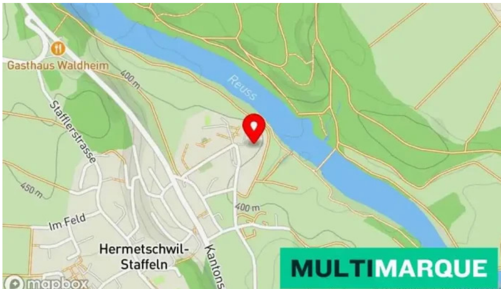
Kloster st martin karte