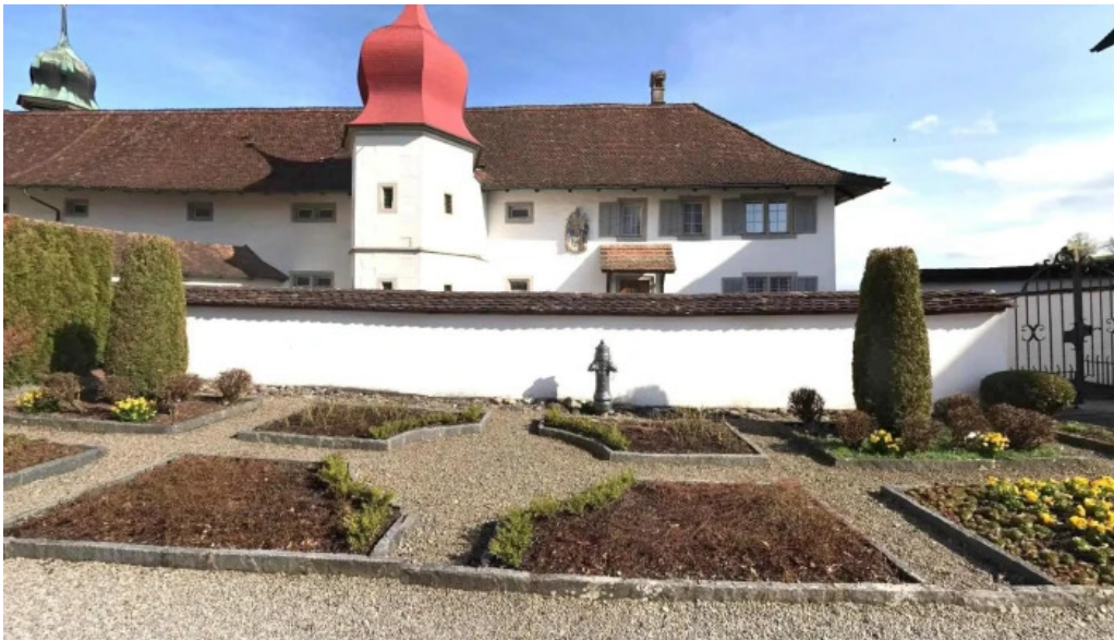
Kloster st martin street view 360deg fotos