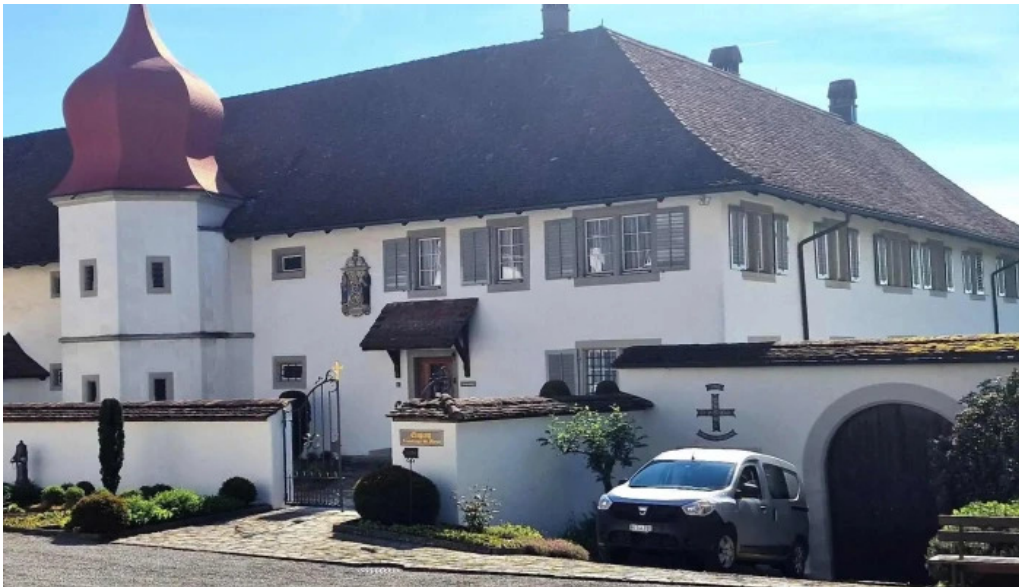
Kloster st martin bewertung