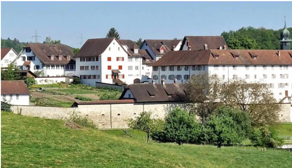
Kloster st martin hermetschwil staffeln