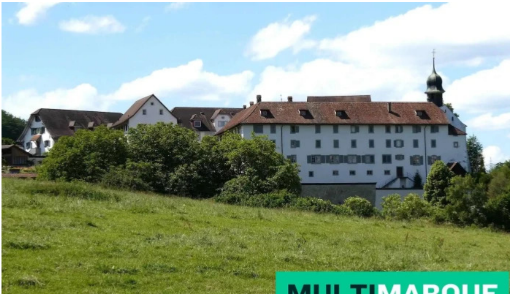
Kloster st martin alle