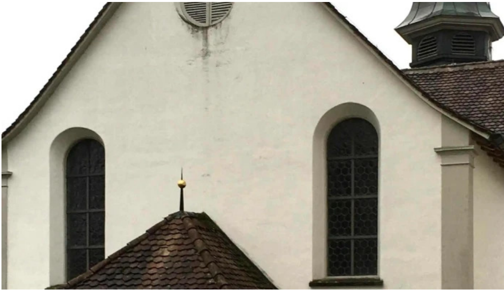
Kloster st martin standort