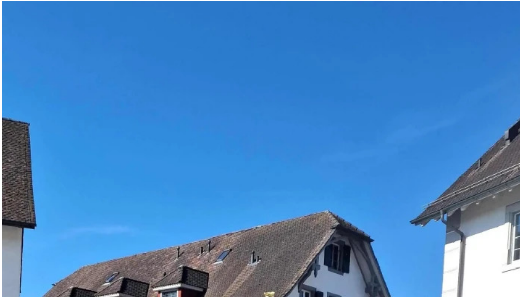
Kloster st martin telefon