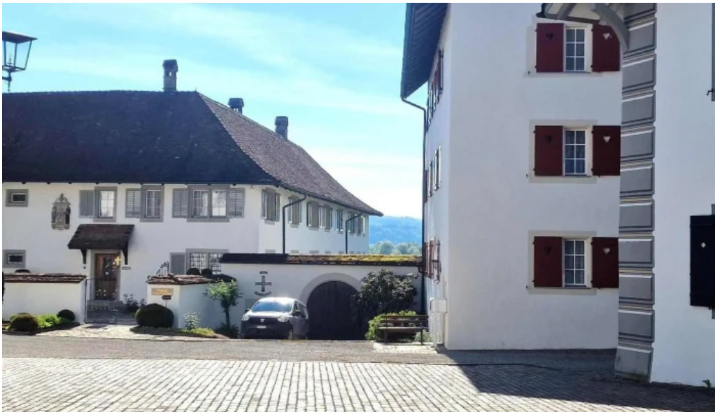
Kloster st martin meinungen