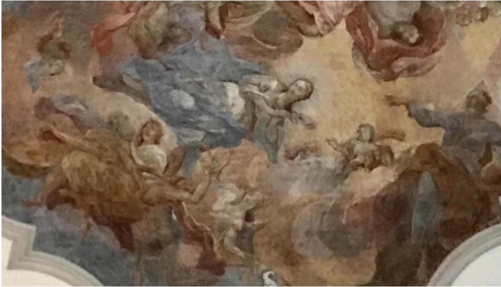
Kloster st martin zone