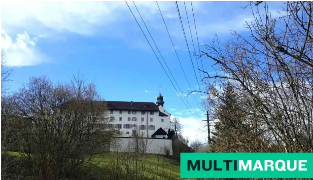
Kloster st martin videos