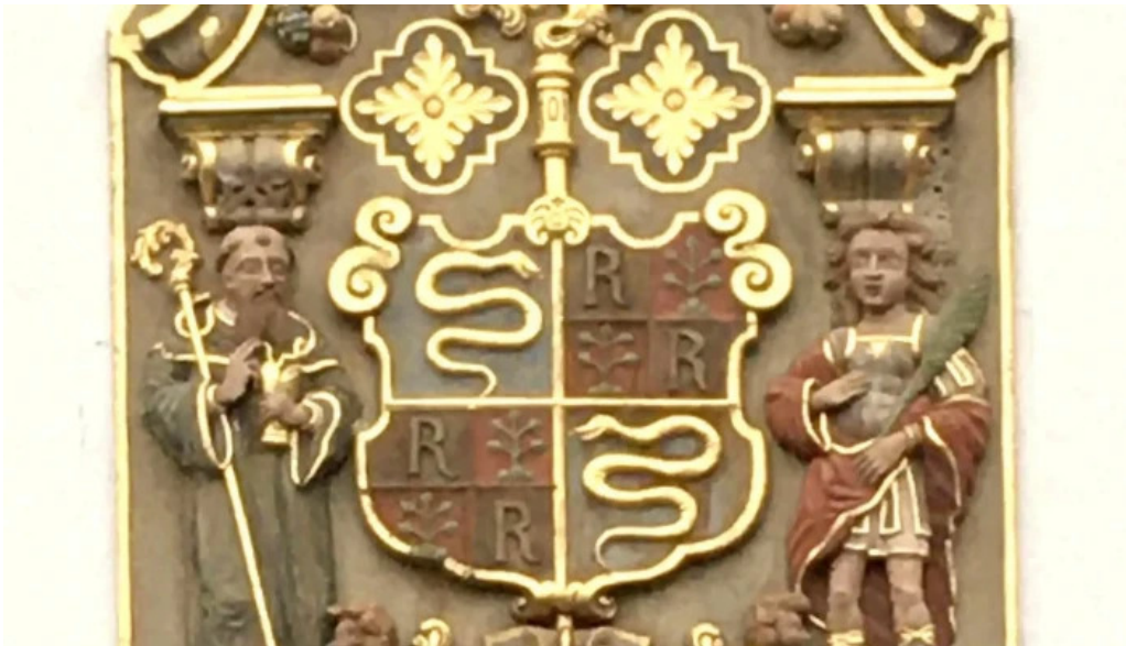
Kloster st martin katalog