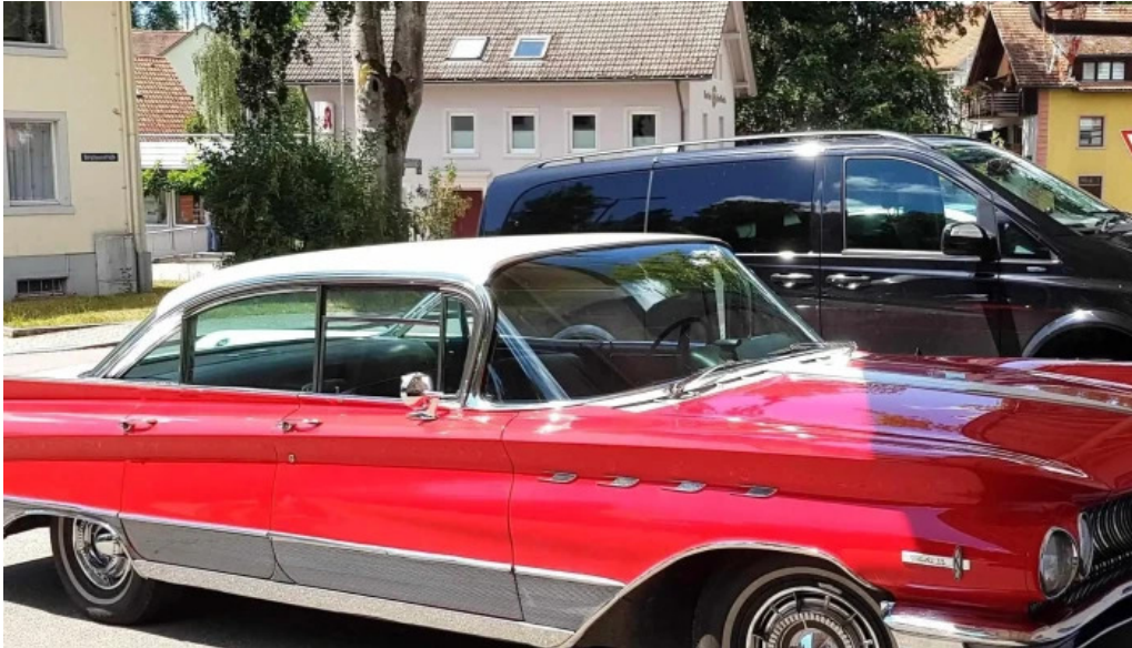
Neue jura garage ag autohandler