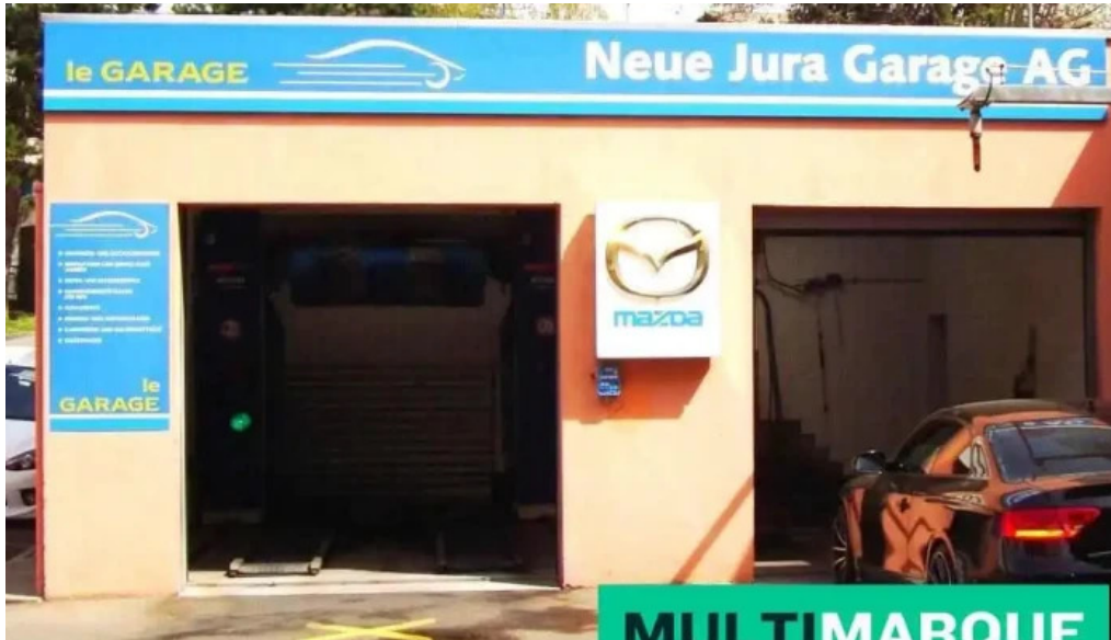
Neue jura garage ag vom inhaber