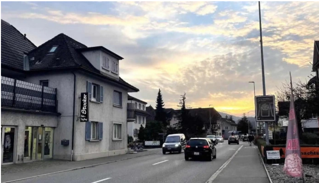
Neue jura garage ag alle