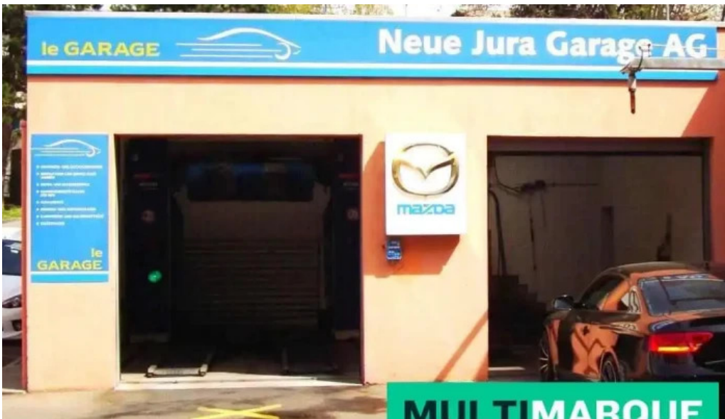
Neue jura garage ag bottstein