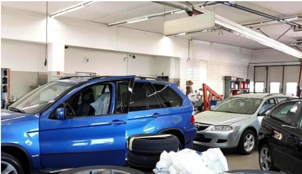
Neue jura garage ag innenansichten